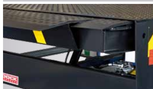
Zijsecties in lip maakt een brede leveler ook geschikt voor smalle vrachtwagens.

naar binnen toe geopend kunnen worden, zodat de “cool chain” niet onderbroken wordt en de hygiëne gegarandeerd is.