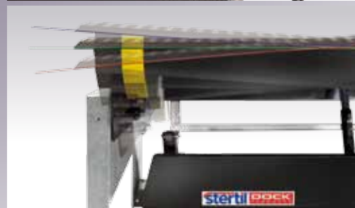
Het platform kan 125mm naar beide kanten torderen