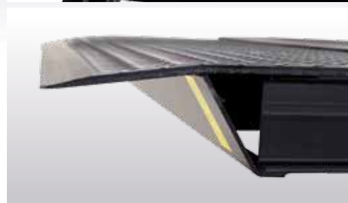
De liphoek is standaard 5,5°