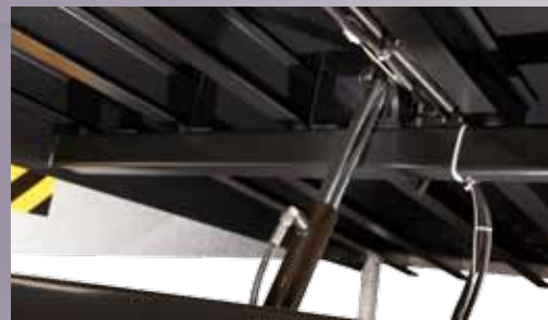
Een hydraulische (hoofd) cilinder