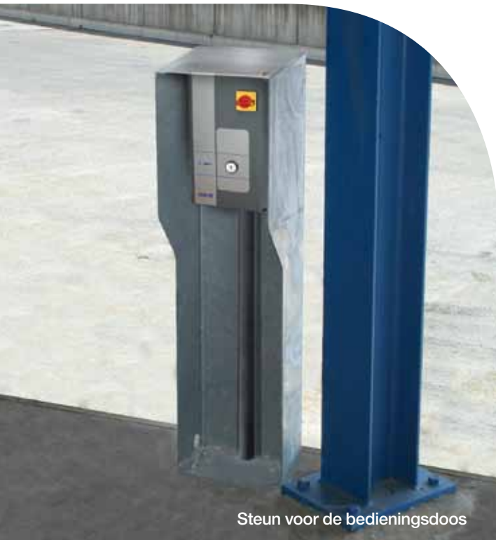
Steun voor de bedieningsdoos