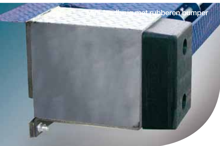
Mini-laadbrug met rubberen bumper