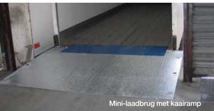
Mini-laadbrug met kaairamp

Onze mini-laadbruggen worden standaard geleverd met PE bumpers. Er kunnen andere bumpers worden geplaatst in functie van het voorziene gebruik. Dankzij ons ruim bumpersgamma, zullen wij u zeker kunnen helpen om een aangepaste bumper te kiezen.